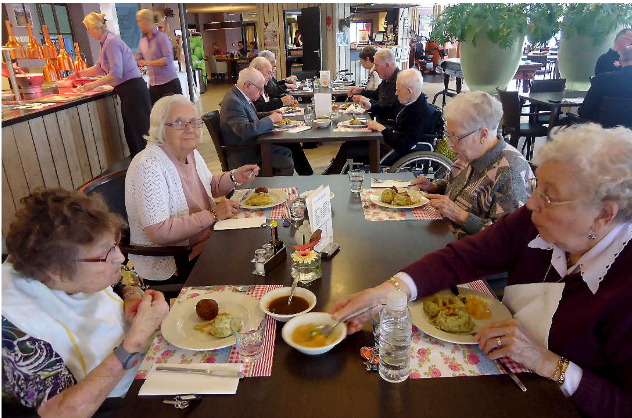
Ouderen genieten in restaurant Tijd van zorgcentrum Ten Anker van de warme maaltijd. Met snijbonen stampot en vleesjus.

Den Helder * De politie onderzoekt brandstichting bij een woning aan de Cronjéstraat. Hoewel de schade ogenschijnlijk meevalt, vormt het brandje een nieuw hoofdstuk in de al zeker twee jaar durende problemen in de straat, resulterend in (auto) branden, vandalisme en woningbraken. Dit leidde onder meer tot een buurtevend en de plaatsing van camera's.