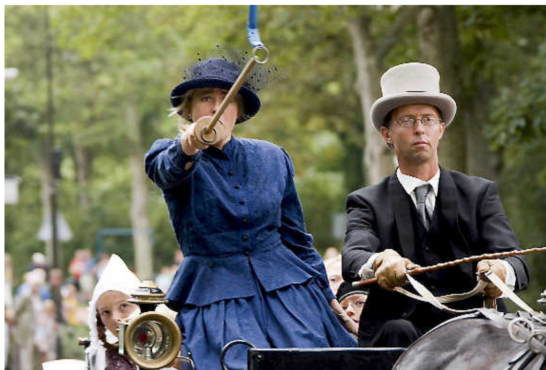
Ringsteken in Abbekerk.

Kon afgelopen jaar iedereen foto's insturen, dit keer vragen we foto- en videoclubs in Noord-Holland om zich aan te melden. Per club kunnen tien foto's en/of maximaal twee filmpjes aangeleverd worden, uiterlijk op 10 juni.