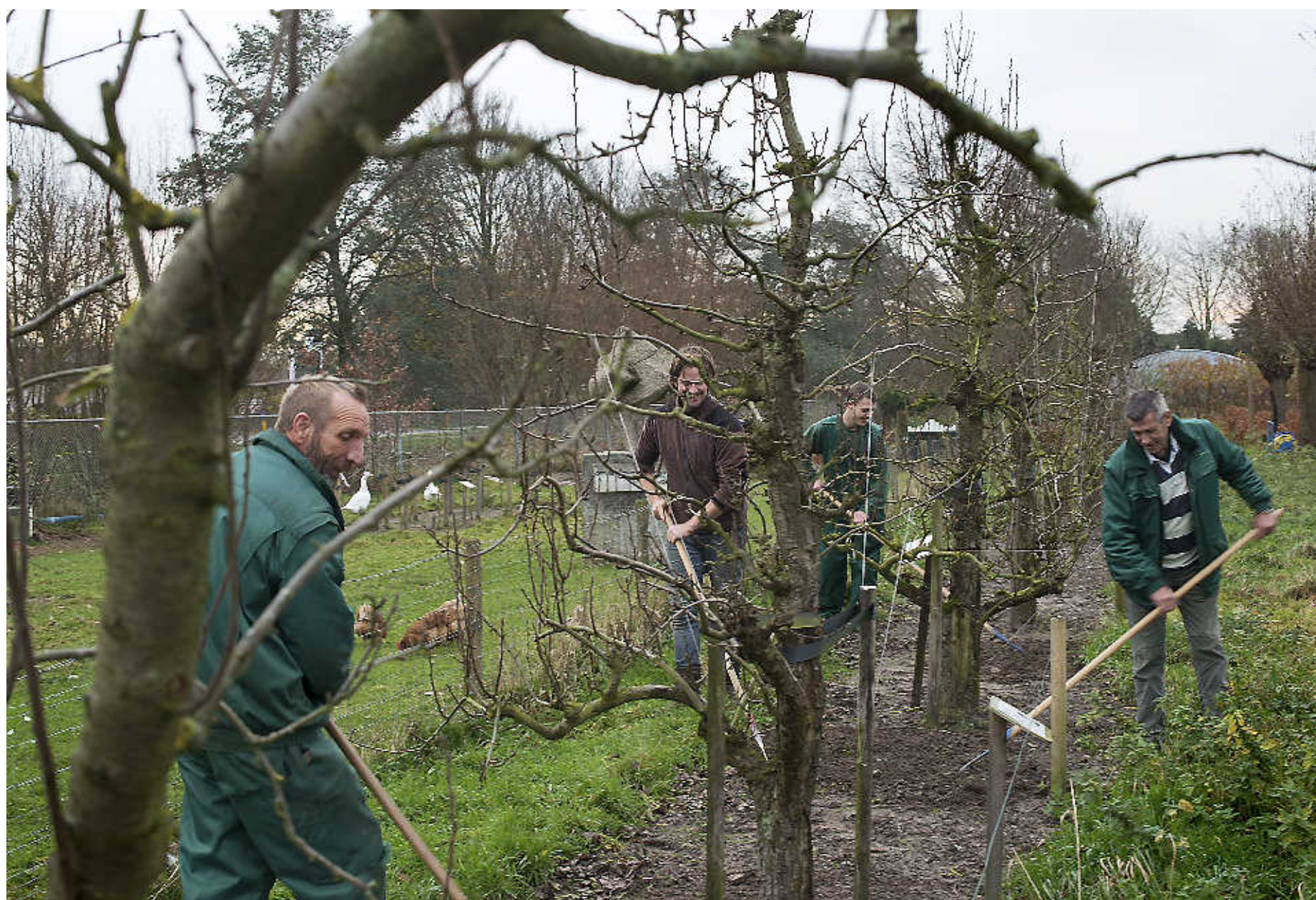
Clënten van de GGZ in Heiloo in de eigen fruittuin. De oogst levert appelmooie en pruimenjam op. De boomgaard is onderdeel van het project voeding bij de GGZ.

In het klein werkt de GGZ Noord-Holland Noord al volgens de opzet van Diverzio. Het project voeding draait er bijna